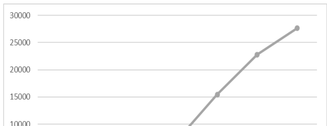
Gráfico 5 - Crescimento do número de cursos de graduação na modalidade EaD e respectivos polos presenciais

O sistema federal de educação superior cresceu como um todo, como apresentado no capítulo 2, mas cresceu a taxas ainda maiores na modalidade EaD, conforme dados do Gráfico 5: